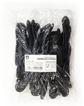
Imagen de paquete