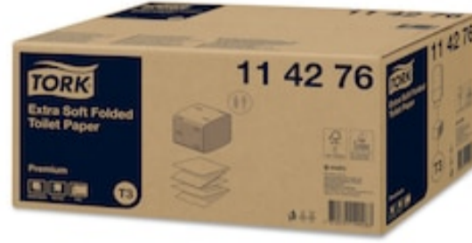
Tork Papel Higi.Plegado Extra Suave 2p 114276