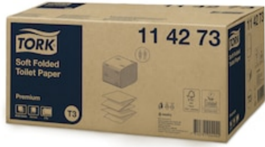
Tork Papel Higiénico Plegado Suave 2p 114273