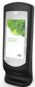
Tork Xpressnap® Stand Disp. servilletas 272211