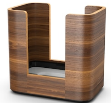
Tork Xpressnap Image Dispensador Servill 273002