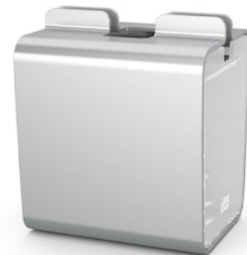
Tork Xpressnap Image Dispensador Servill 274002