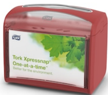
* Tork Xpressnap® Mesa Disp. servilletas 272612