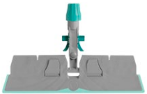
Bastidor Trilogy BCS