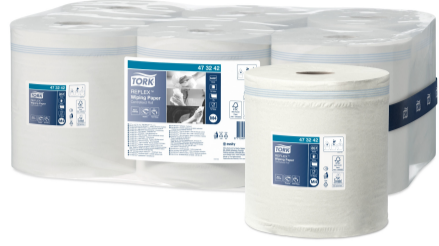
Tork Reflex™ Wiping Paper M4 473242