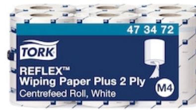
Tork Reflex Wiping Paper Plus M4 473472