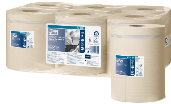
Tork Reflex Natural Wiping Paper Plus 473481