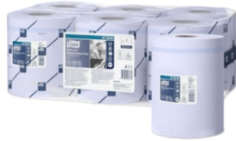
Tork Reflex Wip Pap Plus Blue M4 473391