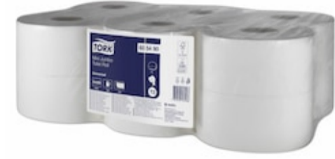
Tork Mini Jumbo TR Uni 1p 290m 605490