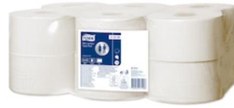
Tork Papel Higiénico Mini Jumbo 120280