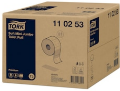
Tork Papel Higiénico Mini Jumbo Suave 110253