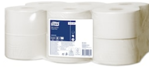
Tork Papel Higiénico Mini Jumbo 120161